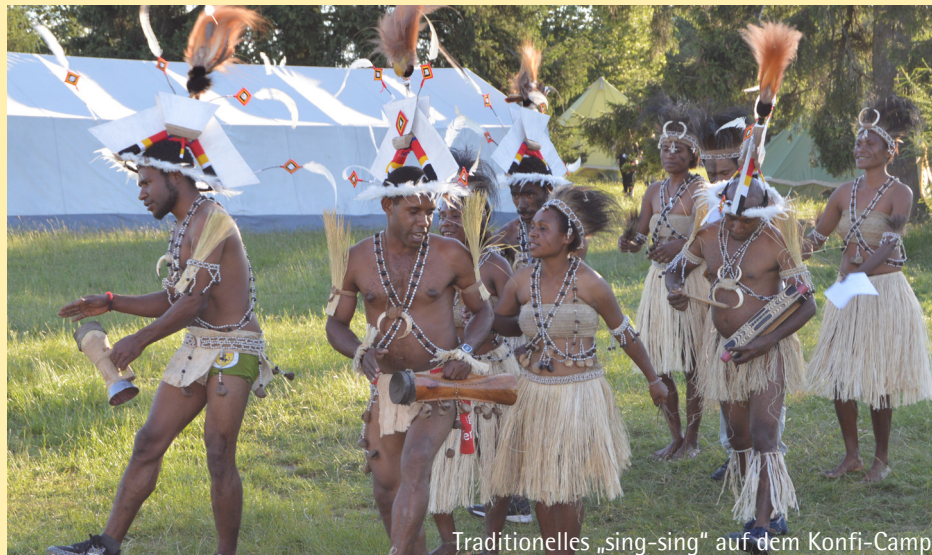
Traditionelles „sing-sing“ auf dem Konfi-Camp

Eine Gruppe Jugendlicher aus unserem Partnerdekanat Boana in Papua-Neuguinea war im vergangenen Sommer zu Gast in unserem Dekanat. Eine für alle bereichernde Begegnung! Herzlichen Dank an alle, die diesen Besuch unterstützt haben.