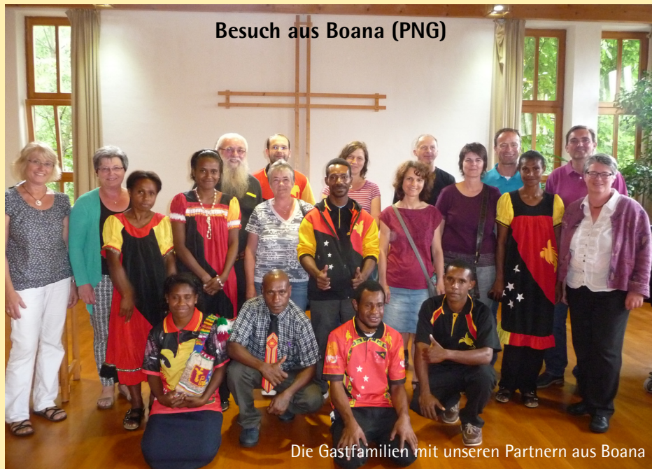
Die Gastfamilien mit unseren Partnern aus Boana

Eine Gruppe Jugendlicher aus unserem Partnerdekanat Boana in Papua-Neuguinea war im vergangenen Sommer zu Gast in unserem Dekanat. Eine für alle bereichernde Begegnung! Herzlichen Dank an alle, die diesen Besuch unterstützt haben.